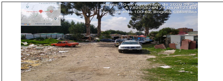
Fotografía 1. Entrada al predio ubicado en la Avenida Calle 153 No. 99 – 35.