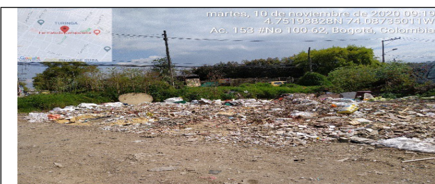
Fotografía 9. Residuos de Construcción y Demolición – RCD esparcidos en el terreno del predio.