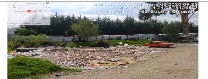
Fotografía 2. Vista externa de la disposición de Residuos de Construcción y Demolición – RCD en el predio.