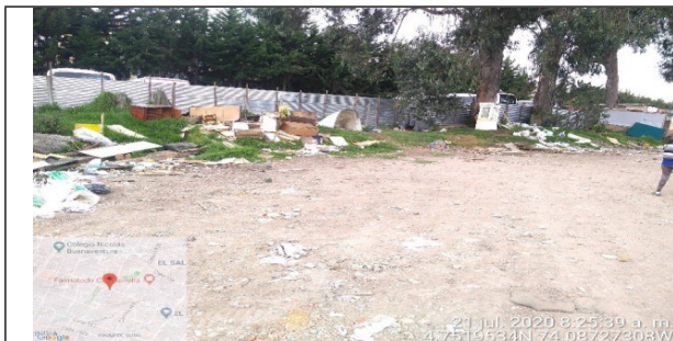
Fotografía 3. Punto de acopio y disposición de Residuos de Construcción y Demolición – RCD de materiales no pétreos como maderas y vidrio, lado occidental del predio.