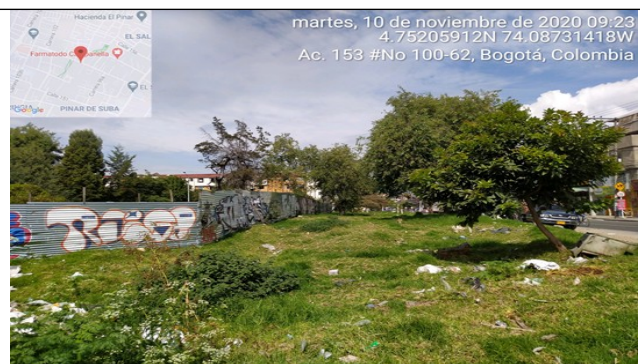
Fotografía 12. Vista al predio ubicado en la Avenida Calle 153 No. 99 – 43 INT: 10. Fuente: SCASP Grupo RCD – Noviembre, 2020.