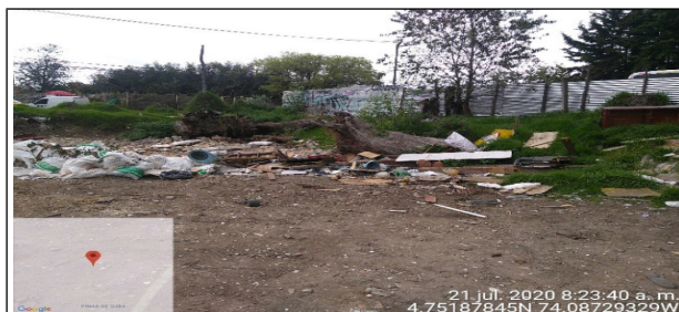
Fotografía 9. Residuos de Construcción y Demolición – RCD esparcidos en el terreno del predio. Fuente: SCASP Grupo RCD – Julio, 2020