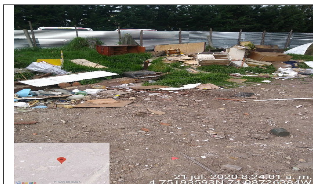
Fotografía 5. Acopio y disposición de RCD de madera y vidrios.