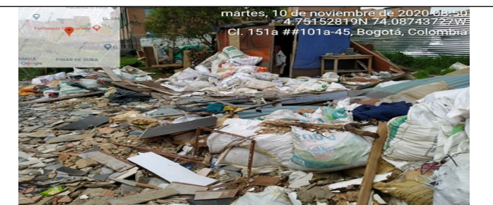
Fotografía 4. Punto de acopio y disposición de Residuos de Construcción y Demolición – RCD mezclados.