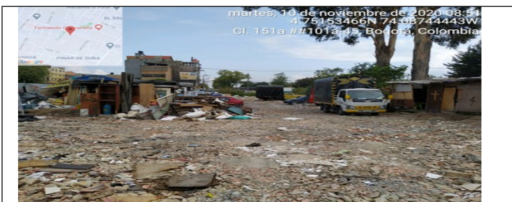
Fotografía 3. Ubicación de la vivienda en el predio.