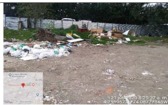
Fotografía 6. Acopio y disposición de RCD mezclado de madera, lonas y muebles.