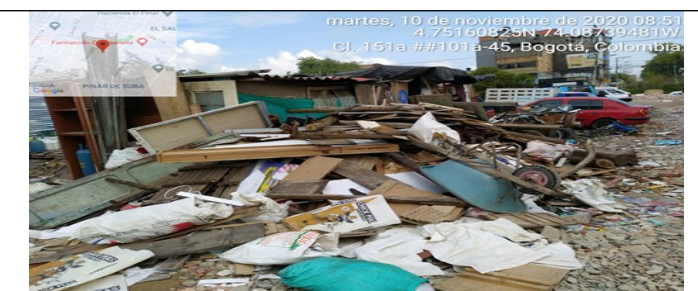
Fotografía 6. Acopio y disposición de RCD no pétreos mezclado.