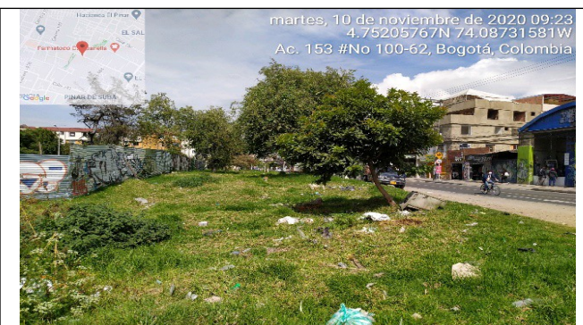
Fotografía 11. Vista al predio ubicado en la Avenida Calle 153 No. 99 – 43 INT: 10.