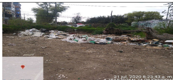
Fotografía 10. Residuos de Construcción y Demolición – RCD esparcidos en el terreno del predio. Fuente: SCASP Grupo RCD – Julio, 2020