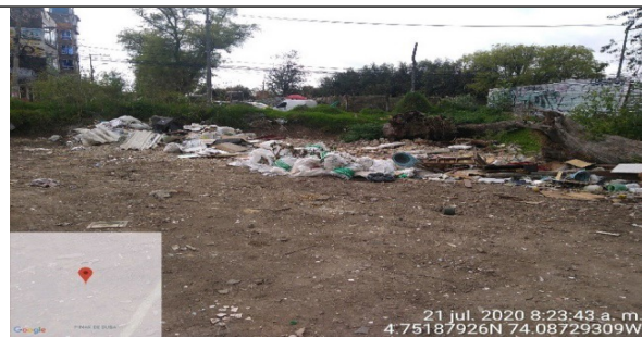
Fotografía 4. Punto de acopio y disposición de Residuos de Construcción y Demolición – RCD mezclados de materiales pétreos y peligrosos (tejas de asbesto).