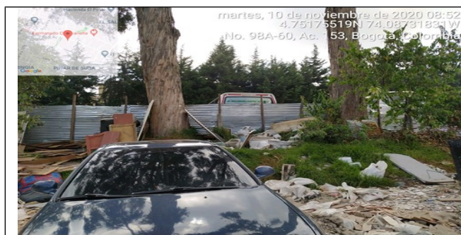
Fotografía 7. Disposición Residuos de Construcción y Demolición – RCD en los fustes de los individuos arbóreos.