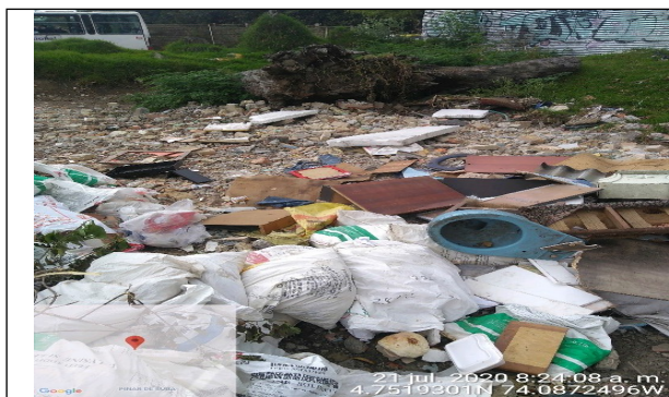
Fotografía 7. Disposición Residuos de Construcción y Demolición – RCD mezclados en el predio.