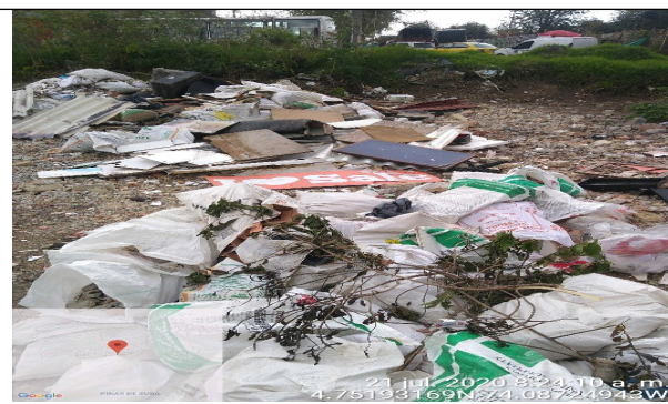
Fotografía 8. Disposición Residuos de Construcción y Demolición – RCD mezclados en el predio. Fuente: SCASP Grupo RCD – Julio, 2020