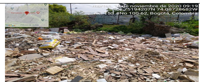
Fotografía 10. Residuos de Construcción y Demolición – RCD esparcidos en el terreno del predio.