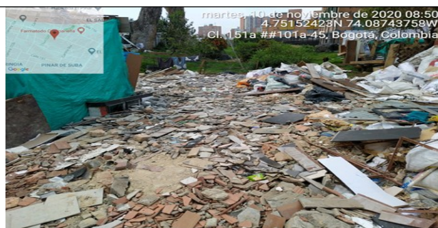
Fotografía 8. Disposición Residuos de Construcción y Demolición – RCD mezclados en el terreno del predio.