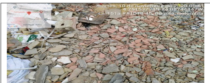
Fotografía 5. Acopio y disposición de RCD mezclado, cerámicos y ladrillos.